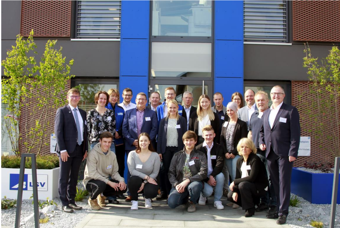
Bild 1: Alle Teilnehmer, Organisatoren des Workshops und Landrat Rößle